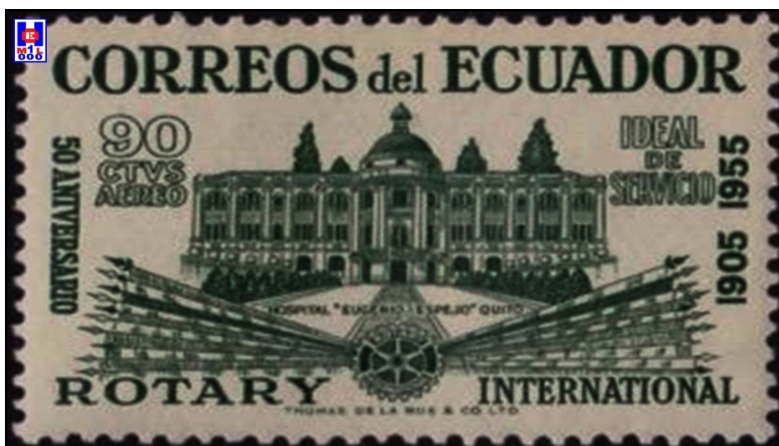
Foto 13 Hospital "Eugenio Espejo". Rotary International, 50th Anniversary. Ecuador, 1905 - 1955

Hoy en día, los hospitales son establecimientos destinados a proporcionar una asistencia médico – clínica, sin perjuicio de que pueda realizarse en él además, en la medida que se estime conveniente, medicina preventiva, recuperación y tratamientos ambulatorios, aparte de ser centros de formación y estudio del personal médico y sanitario y de investigación.