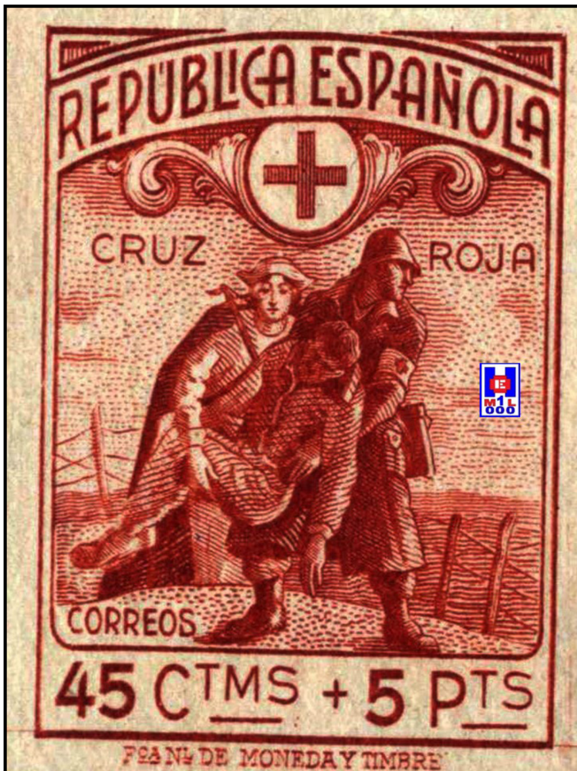
Foto 15 Cruz Roja. República Española, 1938