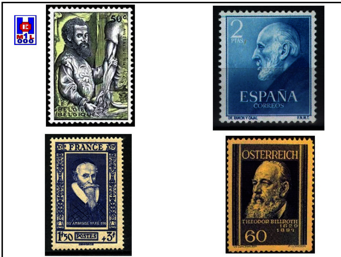
Foto 5 Andres Vesalius. Ambrosio Pare. Ramón y Cajal. Theodor Billroth

Todos ellos, agrupados en secciones, para formar una temática de medicina y posteriormente sanitaria, que bien pudiéramos denominar «La Medicina en la Filatelia», los hemos clasificado en los siguientes capítulos, en los cuales se van incluyendo con la referencia del sello, utilizando como nomenclatura de cada uno, la empleada en el universalmente conocido catálogo francés, de la firma Yvert y Tellier (1).