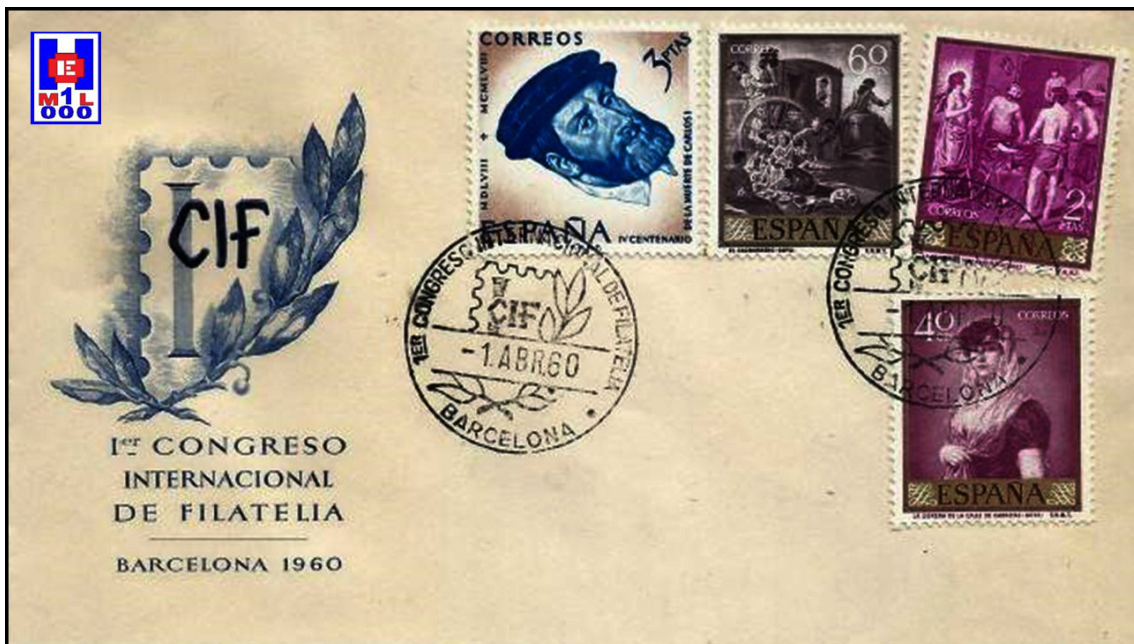
Foto 3 Sobre del Primer Congreso Internacional de Filatelia, celebrado en Barcelona, 1960

Según un relato, una bala de cañón llevaba dirección de impactar sobre él, pero la figura, milagrosamente, se ladeó ligeramente esquivando el proyectil, Así quedó. Se le atribuyen muchos milagros. Como pueden comprobar, el matasello lleva fecha 27 de marzo de 1960. Lo que quiere decir que ese mismo día pudo suceder otros acontecimientos, tales como: la muerte del ilustre médico don Gregorio Marañón, miembro de la Real Academia de Medicina y fundador del Instituto de Patología Médica y gran escritor y ensayista.