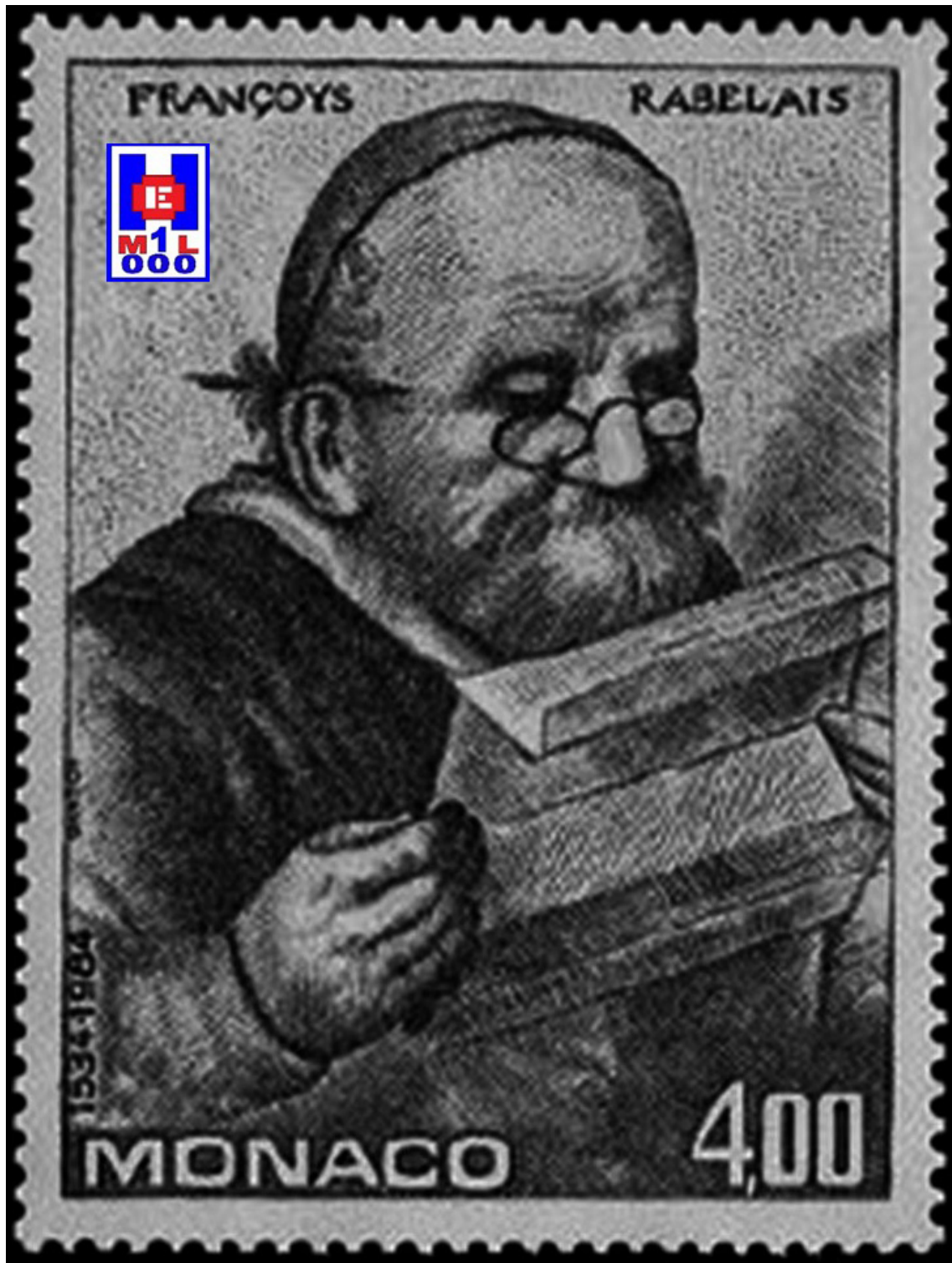
Foto 18 Presbicia, Monaco

Son todos aquellos sellos que reproducen o representan motivos relacionados con esta temática.