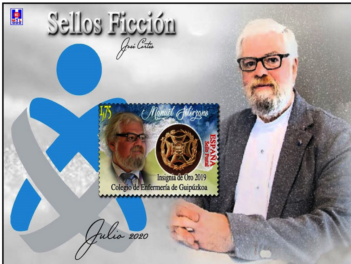
Foto 21 Dentro del Año Internacional de las Enfermeras, queremos tener presente también a todos aquellos varones que desempeñan con plena vocación esta profesión tan elemental en la salud universal. Que nos sirva de referencia simbólica el sello que hoy hemos elegido para que, a través de él, homenajear a todos los varones enfermeros de nuestro

http://enfeps.blogspot.com.es/2016/01/jose-eugenio-guerra-gonzalez-doctor.html