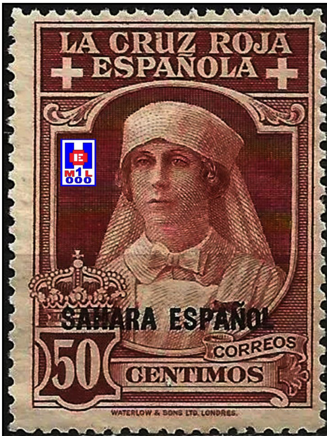
Foto 8 Reina Victoria Eugenia. Enfermera Dama de la Cruz Roja