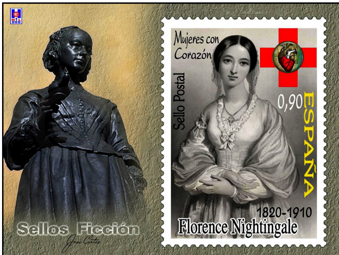
Foto 19 Florence Nightingale 1820 – 1910. Sellos de ficción de José Cortés Fernández