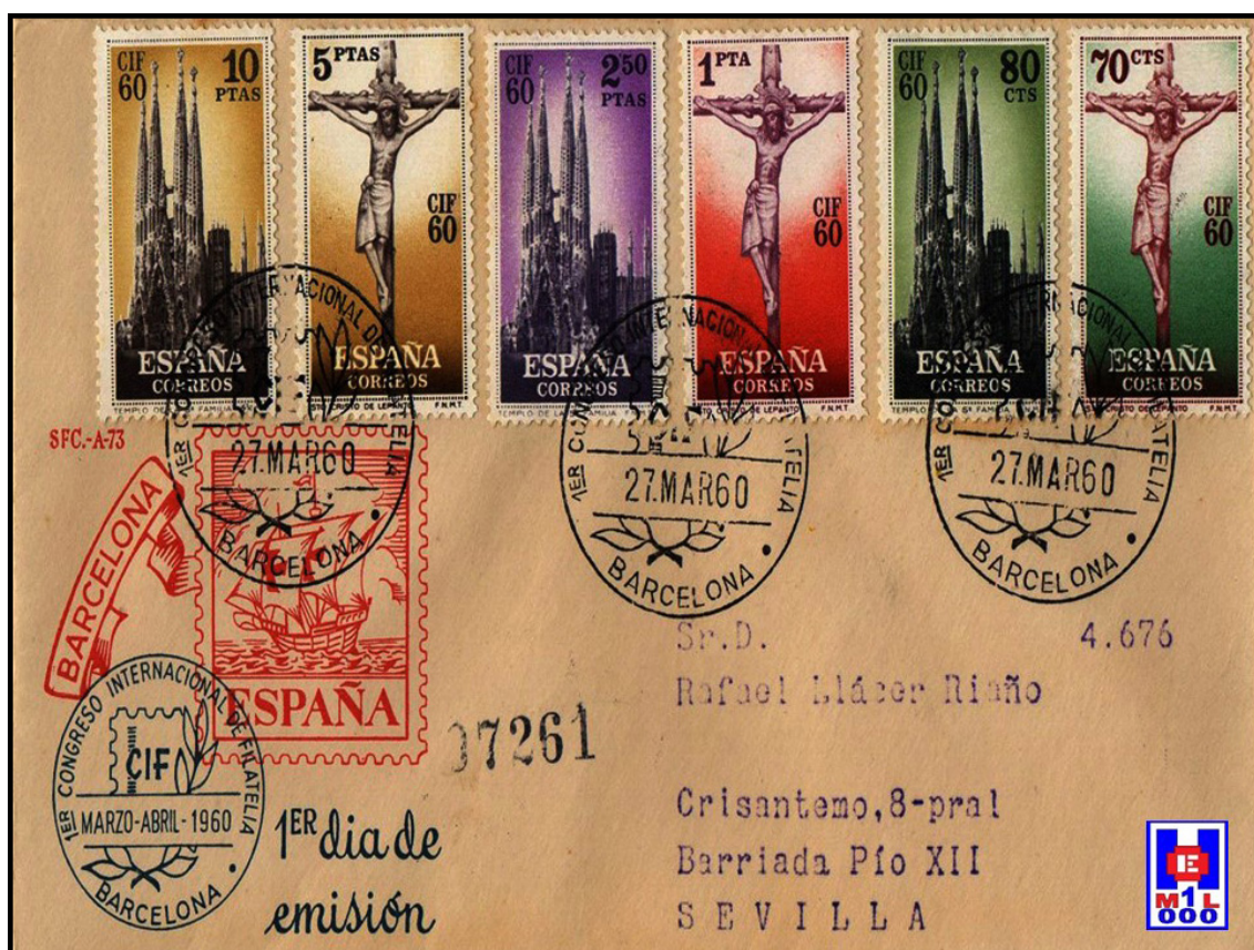
Foto 2 Para conmemorar este congreso de Barcelona, Correos emitió este sobre el primer día de emisión del Primer Congreso Internacional de Filatelia en Barcelona, 1960. En el aparecen los sellos con dos motivos: el templo de la Sagrada Familia, obra arquitectónica maravillosa de Gaudí, y el Cristo de Lepanto de la Catedral de Barcelona

En los años sesenta, en los congresos celebrados por la «FIP» ( Federación Internacional de Philatelie ) y la «FIPCO» ( Federation Internationale de Philatelie Constructive ) respectivamente, adoptaron el Reglamento vigente en esos años para estos tipos de colecciones temáticas, especificando bajo un articulado, las normas establecidas para esta nueva modalidad del coleccionista de sellos.