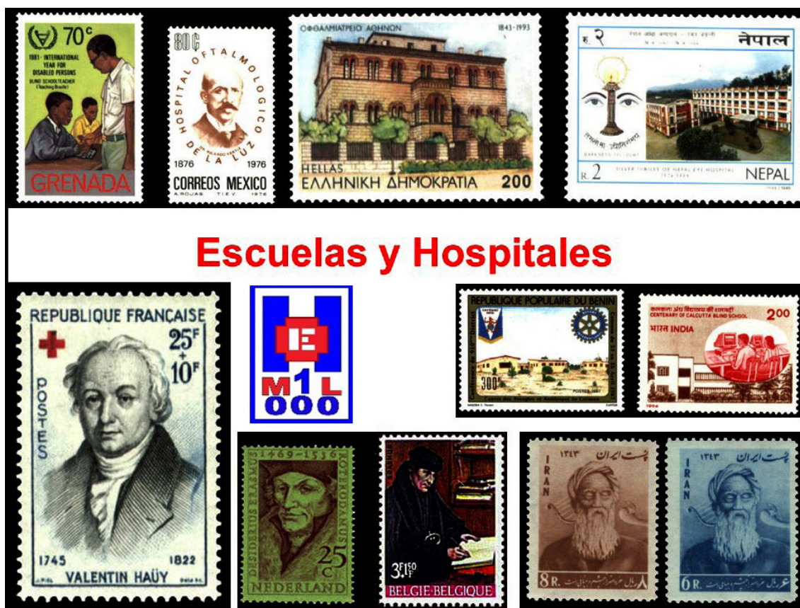
Foto 16 Escuelas y Hospitales

Aparecen en los sellos de correos todos aquellos medios de traslación sanitaria que se reflejan en ellos, para el transporte de soldados heridos o enfermos.