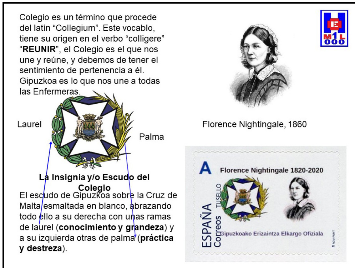
Foto 20 Sello del Colegio Oficial de Enfermería de Gipuzkoa y Florence Nightingale

http://sellosficcio.blogspot.com/search/label/Enfermeras