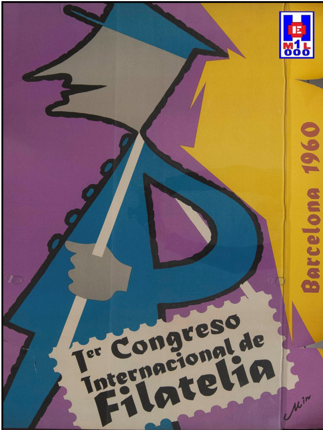
Foto 4 Cartel anunciador del Primer Congreso Internacional de Filatelia, celebrado en Barcelona, 1960

hechos se inició un boicot a “La Vanguardia” entre los lectores, anunciantes y vendedores originando un descenso de 10.000 ejemplares (2).