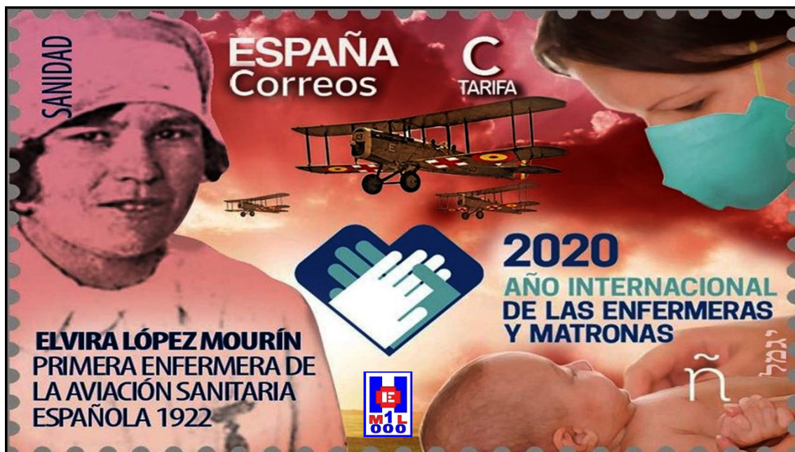
Foto 11 Sello de correos de Elvira López Mourín homenajeando a las enfermeras y matronas en el Año Internacional 2020