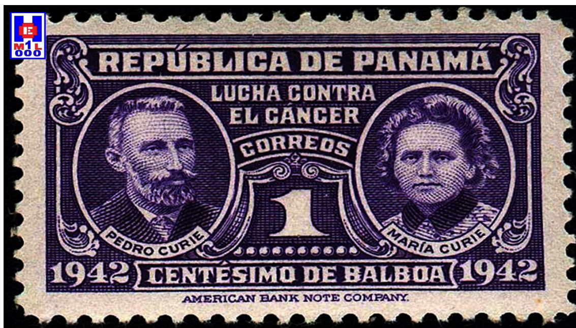
Foto 12 Lucha contra el cáncer. Pedro Curie y María Curie. República de Panamá, 1942